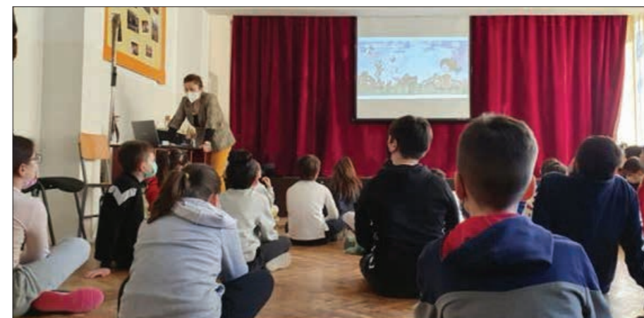
Activitate de proiect eTwinning, Școala Elena Doamna din Tecuci

„Fiecare proiect în care am lucrat cu copiii mei e încărcat de emoție și bucurie, dar dacă ar fi să aleg unul dintre ele, ar fi acel moment în care copiii scriau pentru prima dată mesaje partenerilor în chatul din TwinSpace. Nu erau mesaje lungi, doar salutau și se prezentau, dar le văd și acum fețele radioase, ochii strălucind de emoție și încântarea de a primi răspuns de la parteneri! Și, ca reacții ale copiilor care-mi vor rămâne mereu în suflet, este momentul în care copiii mei de anul acesta, clasa pregătitoare fiind, au văzut un-