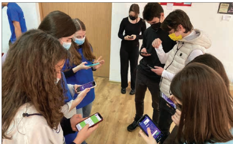
Activitate de proiect eTwinning la Colegiul Național Petru Rareș din Beclean