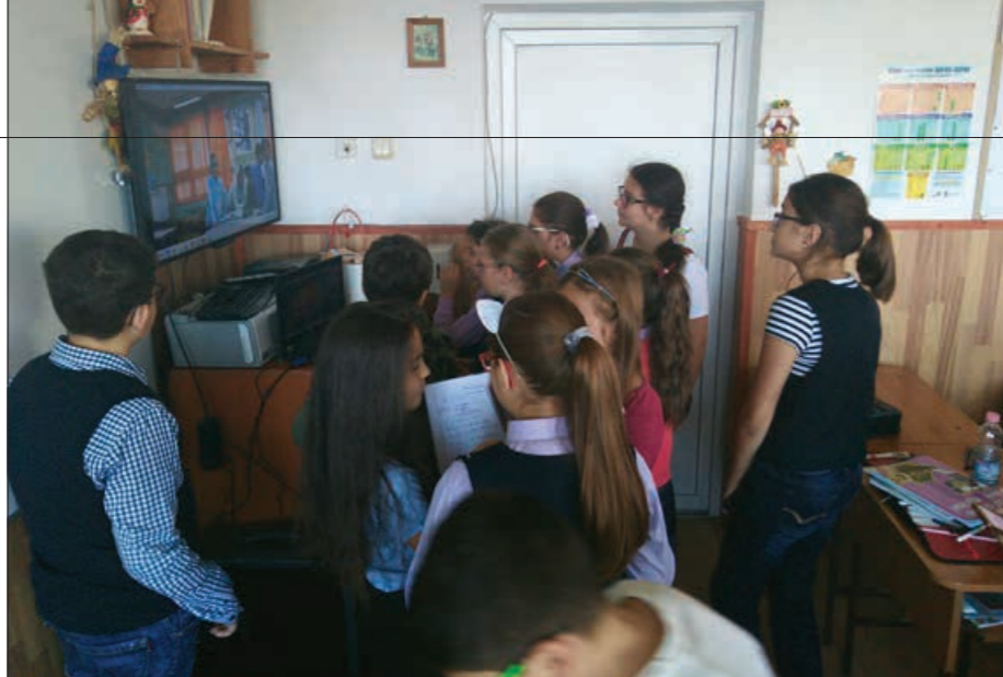
Activitate eTwinning la Școala Gimnazială nr. 17 din Botoșani