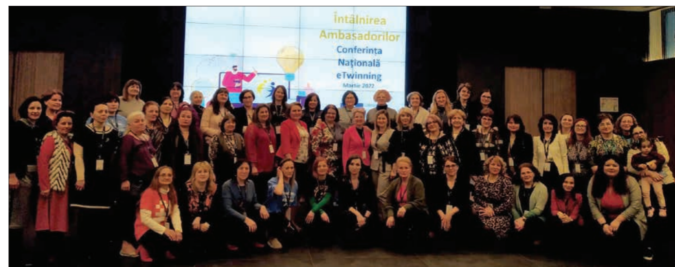
Conferința națională eTwinning

„Pentru mine, eTwinning e ca o bibliotecă uriașă în care descopăr mereu lucruri noi, în care întâlnesc oameni pasionați care se transformă, în scurt timp, în parteneri și apoi în prieteni. E locul unde creativitatea e la ea acasă și unde se formează cu adevărat abilitățile secolului 21. Ca profesor, am ocazia să învăț din experiențele colegilor mei și pot să deschid ușile sălii mele de clasă către o lume fascinant de bogată în tradiții, în istorie, în cultură. Astfel, copiii devin conștienți de dimensiunea europeană a existenței lor,