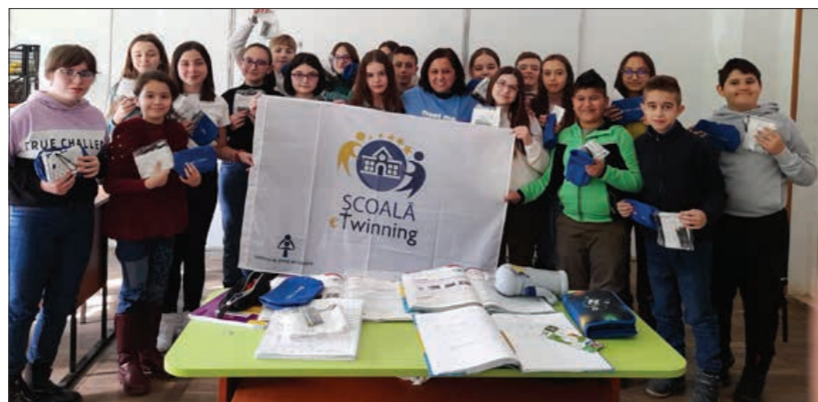
Activitate de proiect eTwinning la Liceul Tehnologic Carol I, Valea Doftanei

„Am descoperit eTwinning prin 2009, iar prima întâlnire a fost întâmplătoare: l-am descoperit singură, grație internetului și, de atunci, a rămas o constantă în